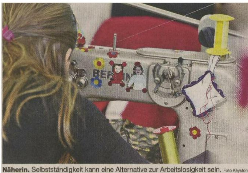
Näherin. Selbstständigkeit kann eine Alternative zur Arbeitslosigkeit sein.

Kleinstkredite helfen Mittellosen in die Selbstständigkeit und leisten einen Beitrag gegen die Wirtschaftskrise. Was Basel schon seit Jahren für Arbeitslose anbietet, gibt es in Zürich jetzt für alle.